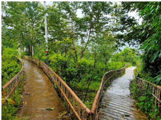
结布德小组茶园步道