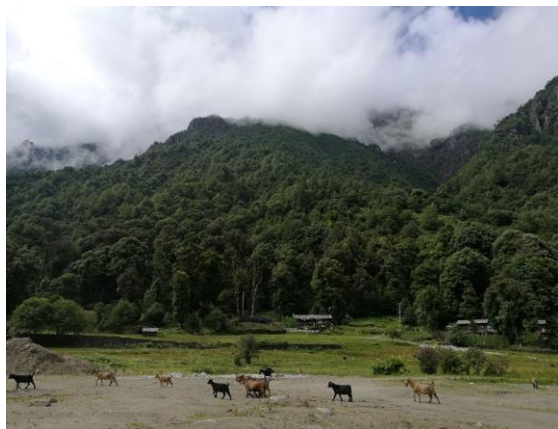
十八公里休憩处 (餐馆)