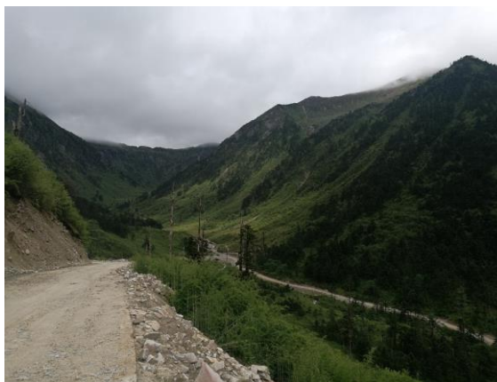
从步道前往31号界碑的土路