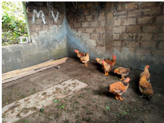
结布德小组饲养的土鸡