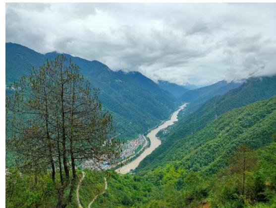
徒步区域俯瞰怒江大峡谷